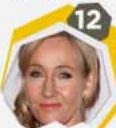
12 جي كي رولينج مؤلفة سلسلة روايات هاري بوتر السبع المحبوبة