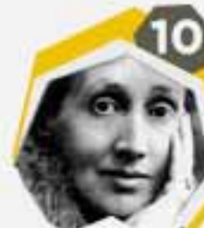
10 أدلين فرجينيا وولف كاتبة إنجليزية