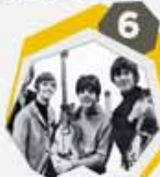
6 البيتلز أشهر موسيقي الروك أند رول