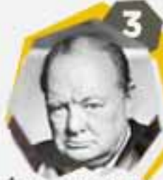
3 وينستون تشر تشر رجل دولة بريطاني وظابط بالجيش وكاتب