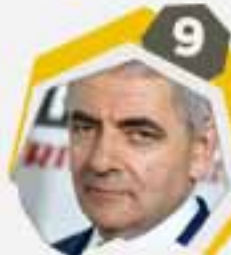
9 روان اتكينسون ممثل إنكليزي وكوميدي وكاتب سيناريو