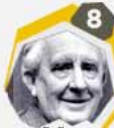
8 جيه آر آر تولكين كاتب وشاعر وعالم لغوي في اللغة الإنجليزية