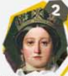
2 الملكة فيكتوريا ملكة المملكة المتحدة 20 يونيو 1837