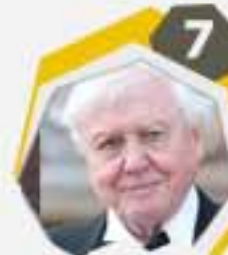
7 ديفيد آتينبورو مذيع إنكليزي ومؤرخ طبيعي