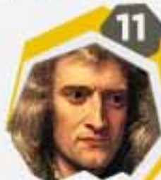
11 إسحاق نيوتن عالم رياضيات عالم فيزياء ، عالم فلك