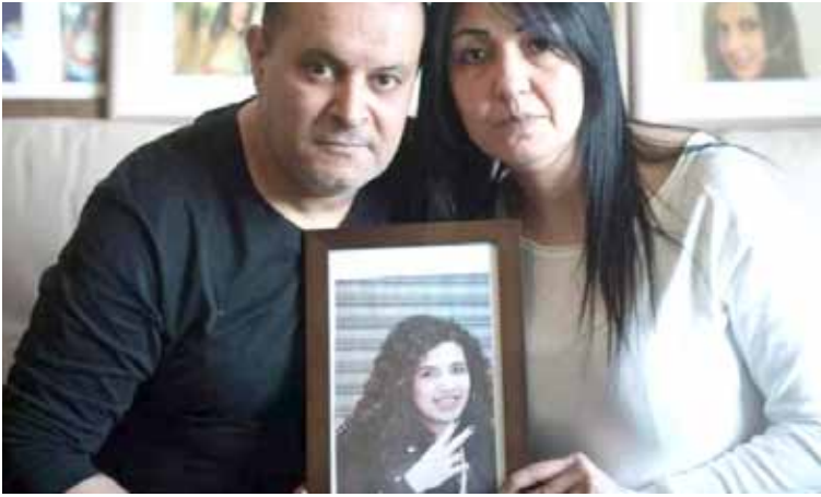
عرب لندن - نوتنغهام