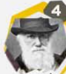
4 تشارلز داروين شاعر وكاتب مسرحي