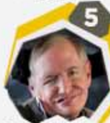
5 ستيفن هوكينج أستاذ الرياضيات السابق لوكاسيان جامعة كامبريدج