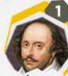
1 وليام شكسبير شاعر وكاتب مسرحي